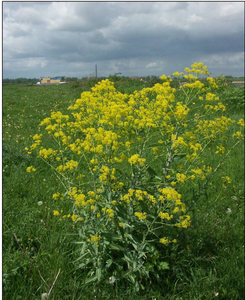
Wede ( Isatis tinctoria ) in een uiterwaardgrasland langs de Waal.