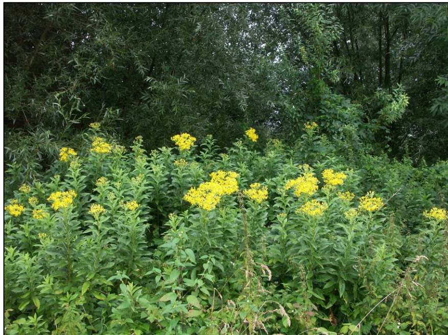
Rivierkruiskruid ( Senecio fluviatilis ) aan de rand van een ooibos bij de Bizonbaai, Ooy.

Het is daarnaast mogelijk dat ontwikkelingen in de nabije toekomst aanleiding zullen geven om soorten toe te voegen of af te voeren. Door natuurontwikkeling krijgen steeds meer soorten de kans zich te vestigen in ons rivierengebied, maar daarnaast geeft ook klimaatverandering en de door menselijke activiteiten gestimuleerde verspreiding van soorten aanleiding tot nieuwe vestigingen.