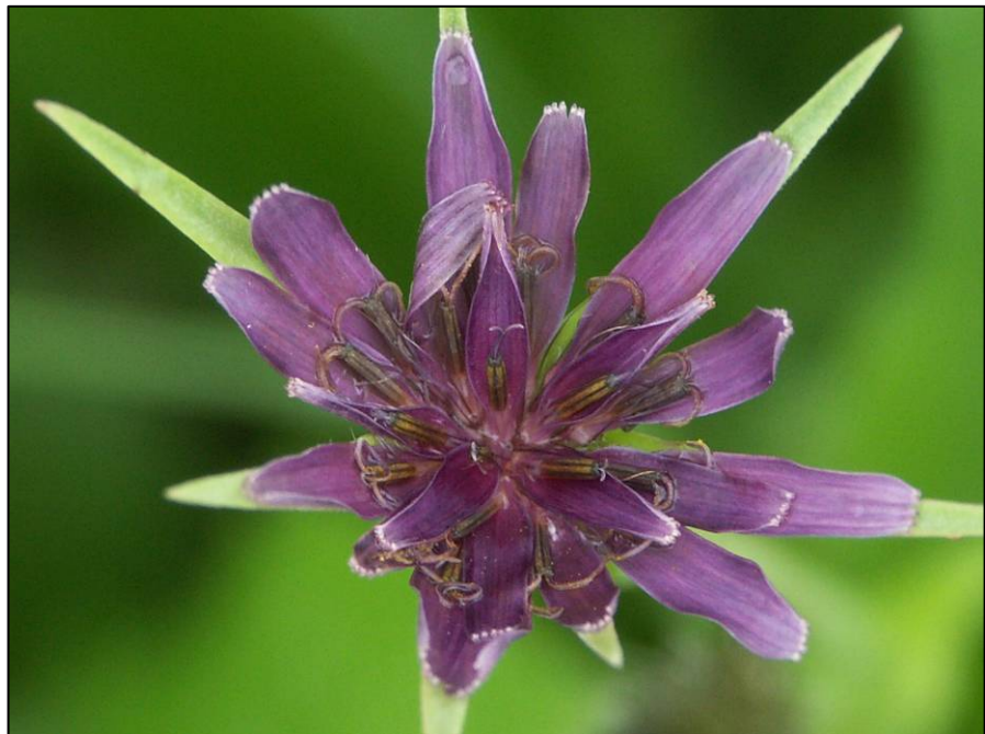
Paarse morgenster ( Tragopogon porrifolius )

De hier gepresenteerde “standaardlijst voor floramonitoring in het rivierengebied” is tot stand gekomen vanuit de behoefte aan een goed bruikbare en op basis van voldoende veldervaring onderbouwde lijst van planten voor de ecologische analyse van ontwikkelingen in het rivierengebied. Tijdens recente onderzoeken naar de ontwikkeling van de flora in het rivierengebied kwam steeds het gebrek aan een geschikte/onderbouwde lijst van indicator- of aandachtsoorten naar voren. Welke soorten neem je mee in je onderzoek en welke niet? Bestaande lijsten bleken steeds opnieuw onvoldoende bruikbaar te zijn. Deze rapportage biedt een lijst van soorten die enerzijds indicatief zijn voor het rivierengebied, anderzijds voldoende zeldzaam om praktisch inventariseerbaar te zijn en trends in het rivierengebied zichtbaar te maken. Een dergelijke lijst kan dan gebruikt worden om bijvoorbeeld de effecten van natuurontwikkeling en beheer te meten en de effecten van herinrichting van uiterwaarden te monitoren. Daarnaast kunnen ook meer algemene ecologische trends en ontwikkelingen ter beleidsondersteuning goed in beeld worden gebracht. De hier gepresenteerde lijst is een standaardlijst voor het inventarisatiewerk in het rivierengebied, door o.a. vrijwilligers, terreinbeherende organisaties, rivierbeheerders en adviesbureaus.